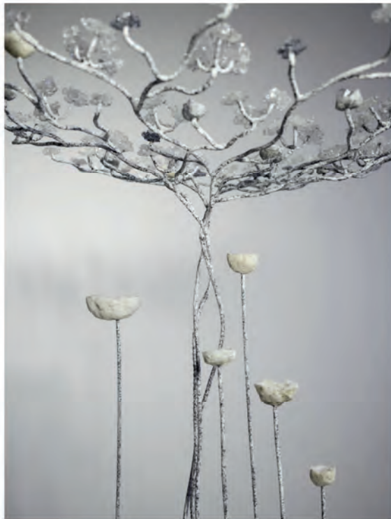
L'Heure Bleue I, 2018 Œuvre unique 70x70x110 cm inox, cristal, celestine, quartz